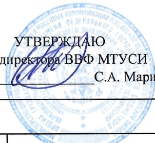
ГРАФИК ПОВТОРНЫХ ПЕРЕСДАЧ