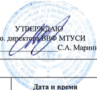
ГРАФИК ПОВТОРНЫХ ПЕРЕСДАЧ