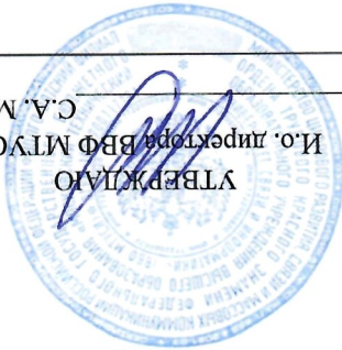
ГРАФИК ПОВТОРНЫХ ПЕРЕСДАЧ